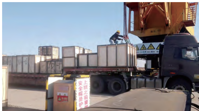
1月25日,装载钢板、发电机组等货物从辽宁丹东出发运输到灌西投资公司青洋码头,塔吊来回吊装,集装箱货车穿梭不断,伴随着新货源的成功落地,标志着青洋物流业务拓展迈上新台阶,日吞吐量达2000余吨,砥砺前行“开门红”。(胡秀同)