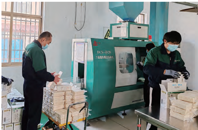
春节假期临近，青口投资公司米业营销中心加大产品生产力度，组织员工满负荷投入生产，积极备货，全力保障节日期间消费者需求，为新的一年米业销售工作开好局、起好步。（郑江）