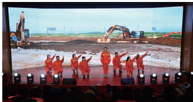
1月22日-26日,台北、华茂公司举办第四届职工“文体周”,陆续开展了混合拔河、同心击鼓、接力赛跑、越野比赛、文艺演出等活动,进一步增强职工身体素质,加强职工之间的交流与合作,提升职工归属感和幸福感。(北工 房金鹤)

一月一考核,有力督促职工学习。每月组织各基层单位的岗位新人进行岗位实操考核,将与近期岗位职责、学习内容紧密相关的重点工作事项进行通关。(许东彦)