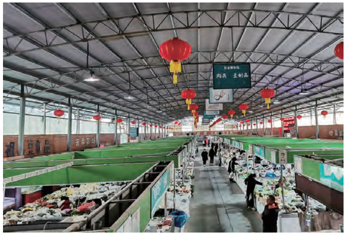
春节的脚步越来越近,金航资产公司巨龙农贸市场管理服务中心积极策划,精心布置,一盏盏火红灯笼高高悬挂,扎眼的中国红,直接把把节日气氛拉得满满的。(航宣)

敲响“纪律警钟”,履职尽责强化监督。积极履行职能职责,深入基层一线对关键环节和关键岗位人员进行监督,使精准监督向基层拓展,把规范权力运行向基层做实,以“最后一公里”的畅通促进监督体系上下贯通。(唐玲)