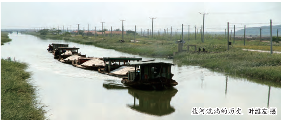
盐河流淌的历史