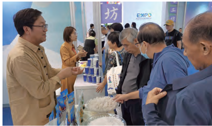
9月21日至24日,江苏省委宣传部和江苏省文化和旅游厅等共同主办的第五届大运河文化旅游博览会在苏州工业园区举办,集团公司的国家级非遗项目“淮盐制作技艺”受邀参展。(工宣)

下一阶段,将围绕制定的“三个一”指标,继续开展好劳动竞赛,形成比学赶超的良好竞争氛围,发挥全体职工的积极性和创造性。(北宣)