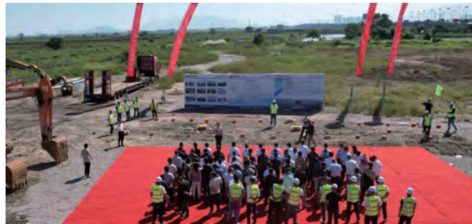
9月22日上午,三峡青口盐场450MW渔光互补“光伏复合”项目开工典礼隆重举行。该项目总投资约为20.025亿元,占地面积约7500亩,计划采用柔性光伏支架、高效N型组件等提高发电量的建设方案,年发电小时数可达到1330小时左右。(仲伟彬)