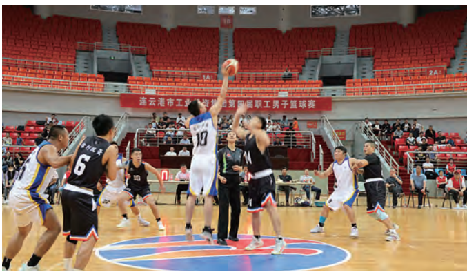
9月23日,集团公司第四届职工男子篮球赛圆满落幕。在为期6天的赛事中,各单位11支代表队、130余名运动员展开激烈角逐。徐圩、灌西、利海氯碱公司联队和台北代表队分获前四名。供电、青口、氨纶公司三支代表队荣获体育道德风尚奖。(工宣工会)

开展文体活动,助推文化建设。今年以来,开展各类文体活动15场次,“结合我们的节日”,开展“暖新行动”“粽情端午”“中秋云端送饼”等各类活动10余次;结合全民阅读,在女职工中广泛开展演讲、朗诵等活动,逐步构建立体化、多元化职工文化服务网络。(航工)