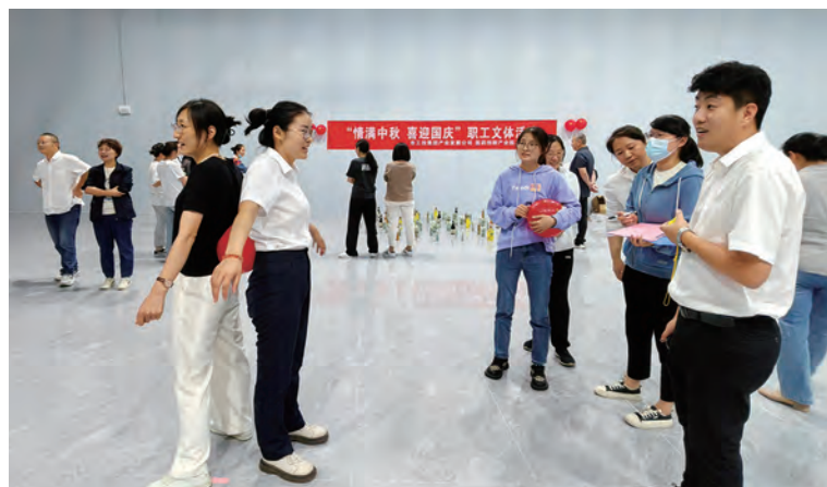
近日,产业发展公司联合医药创新产业园入驻企业开展“情满中秋、喜迎国庆”文体活动,进一步提升入驻企业对园区认同及归属感,增进彼此友谊。(房工)

突出以点带面,助推产业工人创新创效。实施“砥砺前行——建功2023”年度劳动竞赛,开展好技术攻关、“五小”等群众性创新活动,助力生产经营提质增效。深化“青投蓝领3+”产改项目,强化在“思想引领、技能提升、作用发挥”上的带动效应。推进“青蓝工程”,采取“多带一”“一带多”“专业指导”等灵活方式,加强对近两年新招聘员工、岗位调整员工的业务技能传授、帮带,提升职工整体素质。(卢忠敬)