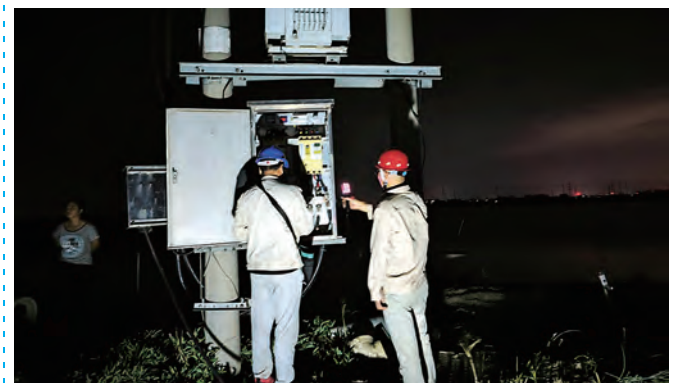
“使用电器,如果手触碰后出现发麻现象,说明电器正在漏电,就需要立即进行修理。”两节前夕,供电工程分公司青口供电所党员志愿服务队深入鱼塘养殖区征询用户用电意见和建议,开展电力设施安全隐患排查,为用户提供优质供电服务。(匡健)

▲9月24日,台北投资公司联合青口、氨纶公司纪委,举办“清风揽明月,廉洁伴中秋”廉洁文化活动,进一步筑牢“国庆、中秋”两节期间廉政自律防线。(房金鹤)