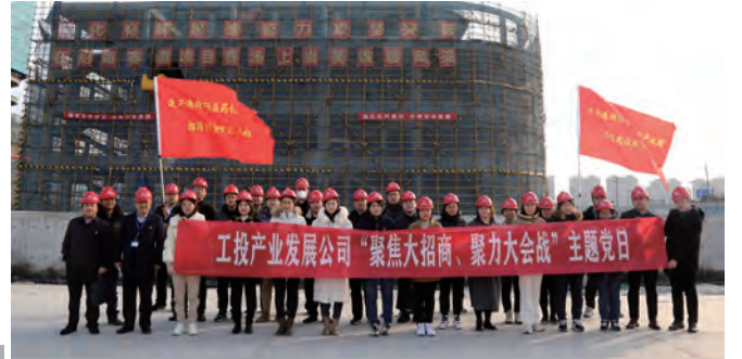
近日,工投产业发展公司组织广大党员赴中华药港国际医药创新产业园开展“聚焦大招商、聚力大会战”主题党日,动员广大党员干部进一步统一思想、坚定信心,掀起“招商引资、项目建设大会战”的大干热潮。(顾卫远)