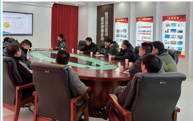
为切实提升一线工作人员理论水平和实操能力,改善电气设备巡视检查的薄弱环节,确保设备安全运行,供电工程分公司技术服务中心于近日组织各单位青年技术骨干集中开展变电设备技能培训。(许海斌)

加大廉政建设执纪力度。开展“学、摆、查、改”整顿活动,做到无禁区、全覆盖、零容忍,解决发生在职工群众身边的违纪问题;开展“嵌入式”监督专项检查,重点监督“三重一大”决策制度落实,全程参与市场开拓、品牌创建等重大事项,把监督做深、做细、做实;公布举报电话、邮箱、微信号,施行党风党纪监督员、特邀监察员机制,畅通监督渠道。加强日常监管,关注业余生活和社交,监督员工“八小时”之外的廉洁自律。(张飞 黄敏)