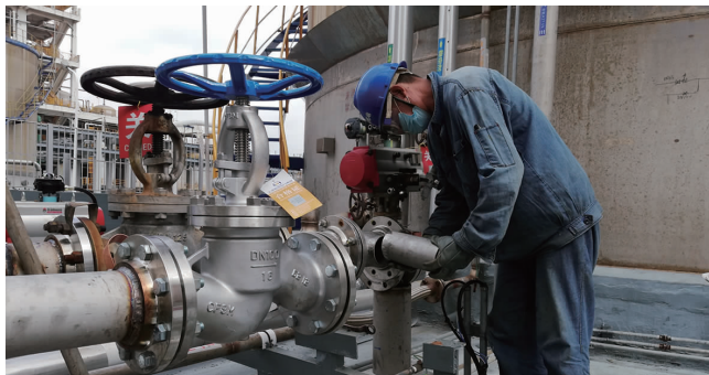
日前,利海化工公司双氧水罐区改造工作正在紧张进行中,预计9月15日完成。此次双氧罐区改造主要是更换50%双氧水卸车管线,配备两台专用卸料泵。改造后,卸车时间缩短至1个小时,有效地提高工作效率,降低劳动强度。(江超)

连日来,徐圩投资公司围绕中心,瞄准“秋收之战”各项指标,养殖、原盐、工程、绿化保洁等战线“总动员”,勠力完成年度目标齐头并进、锲而不舍。