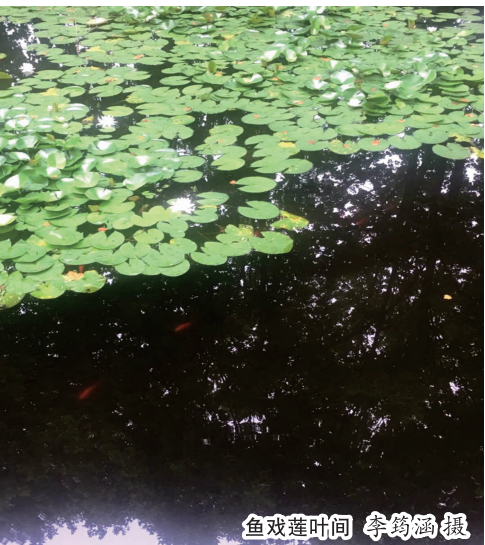
鱼戏莲叶间

一分钟固然短暂，而闪光的一分钟却能创造出奇迹来，创造出财富来。正如巴普洛夫说的一样，我们只有抓紧每一分钟，做好所有该做的事，人生才不会白白浪费。